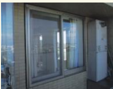
施工前(一般用サッシ)